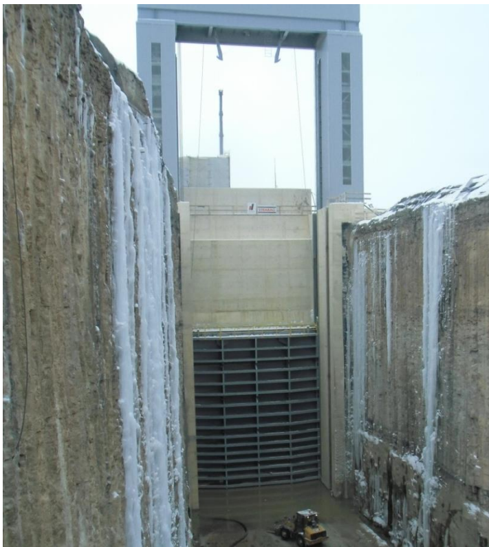
Abbildung 2-4: Auslaufbauwerk vor dem Fluten

Nördlich des Auslaufkanals befindet sich die Flügelmauer des PGS-Stausees mit 6 Turbinen in einem Abstand von ca. 280 m zur Felsbarriere. Das in weniger als 350 m Entfernung zur Felsbarriere bereits installierte Tafelschütz stellte aber das kritische Schutzobjekt dar.