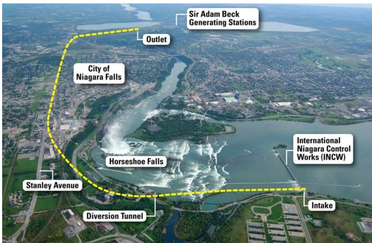
Abbildung 1-2: Projektübersicht

Der 150 m lange Einlaufkanal mit dem Einlaufbauwerk wurde in der Nähe des bestehenden Stauwehrs „International Niagara Control Work“ situiert. Der Umleitungstunnel mit einem Innendurchmesser vom 12,8 m verbindet das Ein- und Auslaufbauwerk. Das Auslaufbauwerk beinhaltet den Schwalltschacht und das Auslassschütz. Dem Auslaufbauwerk folgt ein ca. 380 m langer, 23 m breiter und bis zu 30 m tiefer Auslaufkanal, welcher in den bestehenden Zuleitungskanal führt.