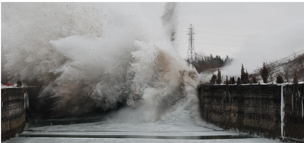
Abbildung 3-5 Sprengung der Felsbarriere am 12/02/2013

Das von den Firmen Castonguay and Explotech entwickelte Sprengkonzept sah 3,5"-Pufferbohrungen im Raster 0,6 \times 1,2 m im Bereich angrenzend an die Reihenbohrungen vor. Die zwischen den Pufferbohrungen angeordneten 3,5"-Sprengbohrungen wurden im Raster 2,1 \text{ m} \times 2,1 \text{ m} ausgeführt und bis 1,8 m unterhalb der Oberfläche mit ca. 95 kg brisantem Sprengstoff geladen. Die oberen 1,8 m der Bohrung wurden mit Kies verschlossen. Um eine erschütterungsarme Lösung zu erreichen, wurde jedes Bohrloch als einzelne Stufe gezündet. Der zentrale Bereich sollte einen Keil in Richtung des PGS-Zubringerkanals lenken und Platz für Nord- und Südbereiche schaffen. Die vorgesehene Gesamtzeit der Zündung betrug weniger als 2 sec.