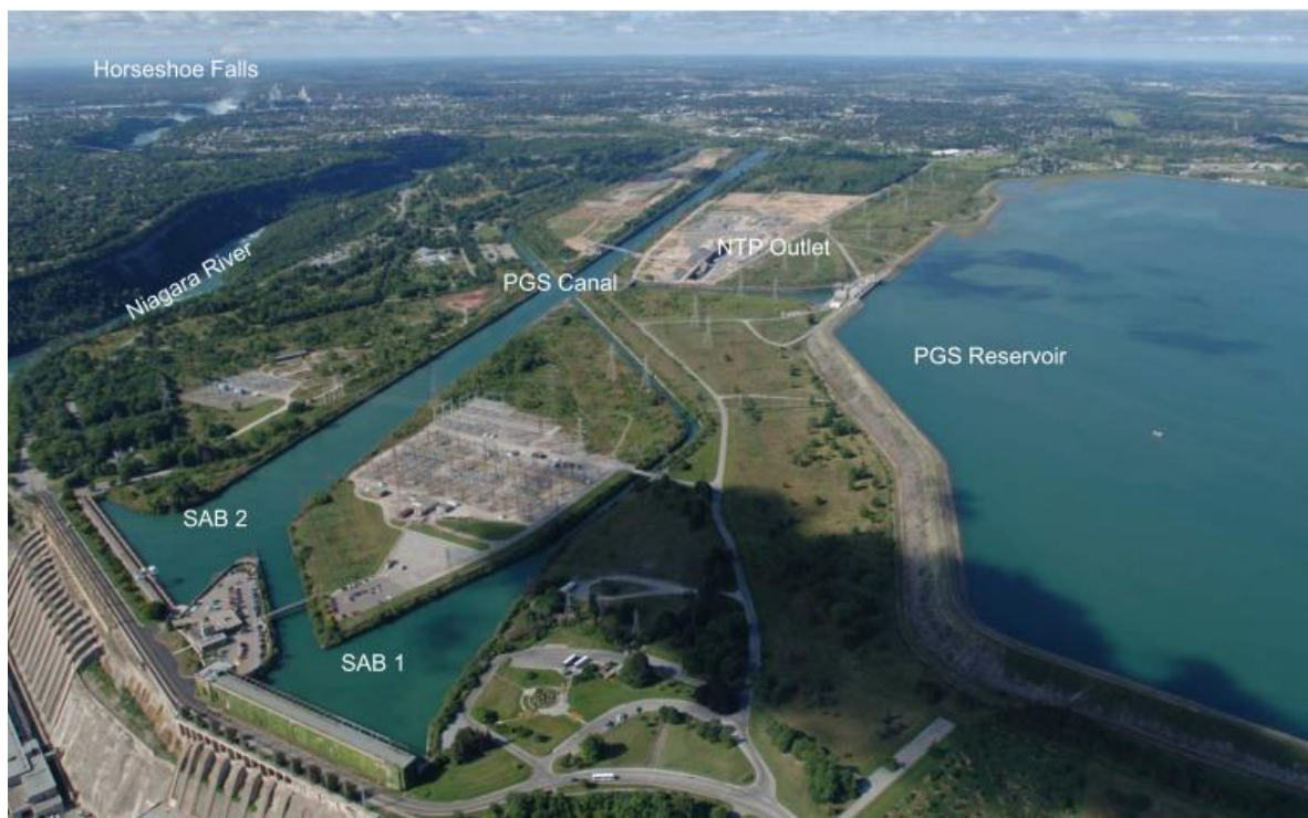
Abbildung 1-1: Sir Adam Beck (SAB) Wasserkraftwerk Ausführung des Luftblasenvorhanges beim Niagara Tunnel Project Dynamik Tage Wien 2016

Die Geschichte der wirtschaftlichen Nutzung der Wasserkraft der Fälle geht zurück ins Jahr 1758, als die Wasserkraft zunächst zum Antrieb von Sägemühlen und dann ab 1881 zur Erzeugung von elektrischer Energie genutzt wurde. Das Niagara Tunnel Facility Project (NTFP) ist eine Erweiterung des Wasserkraftwerkes Sir Adam Beck (SAB). Die erste Stufe des Wasserkraftwerkes (SAB 1) wurde im Jahr 1922 in Betrieb genommen. Durch teilweise Umleitung des Flusses wurde das Wasser über einen Kanal zum 8 km unterwasserseitig der Wasserfälle situierten Krafthaus geführt. Um dem steigenden Strombedarf gerecht zu werden, wurde im Jahr 1954 die zweite Stufe (SAB 2) in Betrieb genommen. Die Kapazität wurde, zu den 10 bereits bestehenden, um 16 neue Generatoren erweitert. Für die Versorgung der neuen Generatoren mit Wasser aus dem Fluss wurden zwei 9 km lange Tunnel unterhalb der Stadt Niagara Falls aufgeföhren.