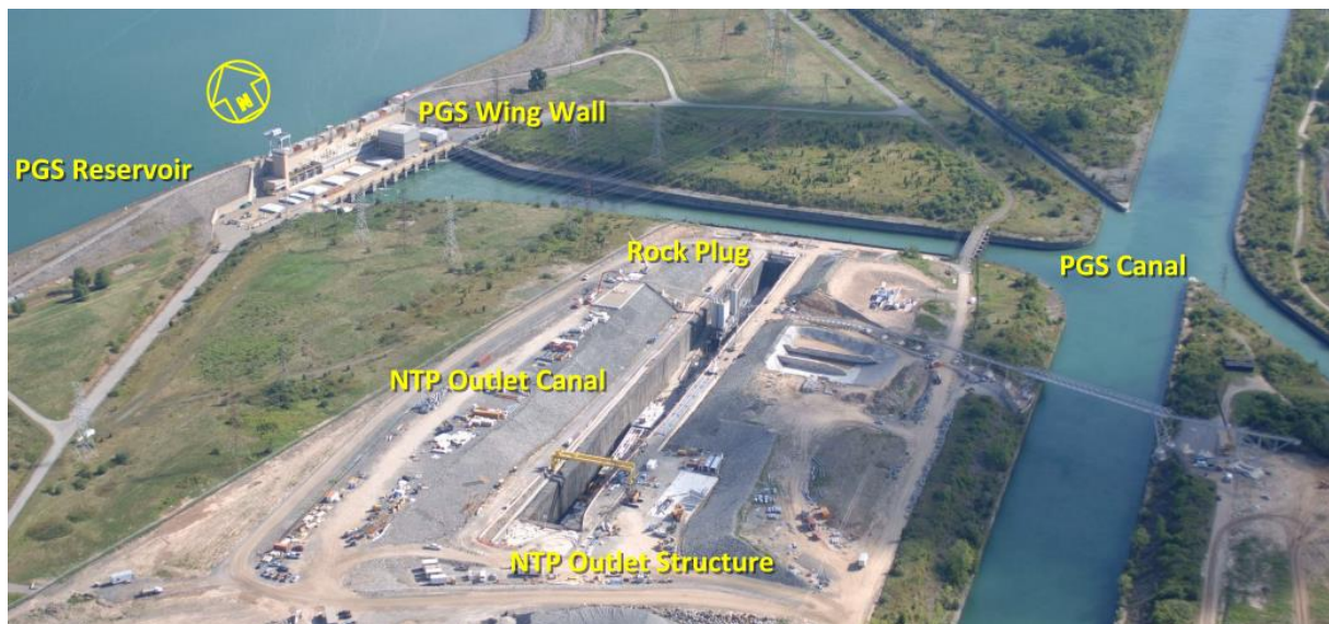
Abbildung 2-3: Auslaufkanal mit Felsplombe

Der Kanal diente als Startgrube für die TBM und bildete in der Bauphase die einzige Zufahrt in den Tunnel. In der Bauphase war dieser Auslaufkanal durch eine 12 m breite und 19 m hohe Felsplombe vom bestehenden im Betrieb befindlichen Kanalsystem getrennt. Nach der Errichtung des Auslaufbauwerkes und dem Einbau des Auslassschützes sollte der Tunnel geschlossen und die hydraulische Verbindung des bis dahin trockenen Auslaufkanals mit dem wasserführenden Kanalsystem hergestellt werden.