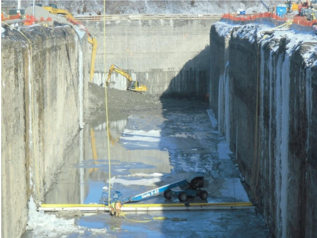
Abbildung 5-7: Montage des Luftblasenvorhanges mit der Felsbarriere im Hintergrund

Der Luftblasenvorhang wurde im Auslaufkanal außerhalb des Wurfbereiches des Haufwerks in einem Abstand zur Felsbarriere von ca. 200 m situiert. Die Verlegung des Luftblasenvorhanges zur Schutz der in PGS-Stützmauer befindlichen Turbinen, konnte im bestehenden PGS-Zubringerkanal aufgrund der Nähe des bestehenden Hochspannungsnetzes nur in einem Nahbereich östlich der Felsbarriere ausgeführt werden.