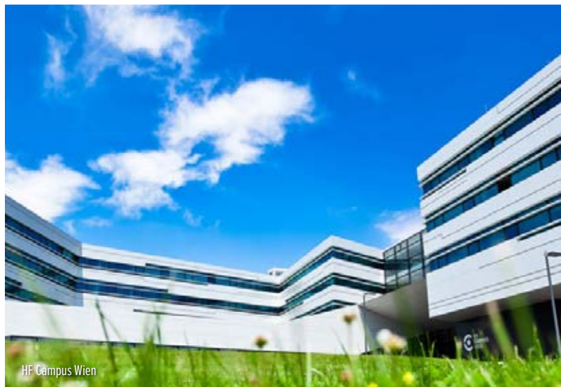
HF Campus Wien