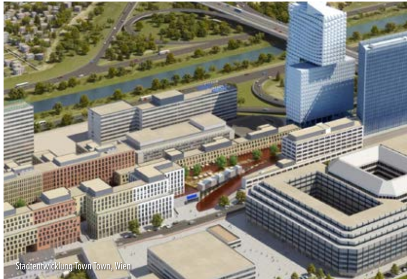
Stadtentwicklung Town Town, Wien