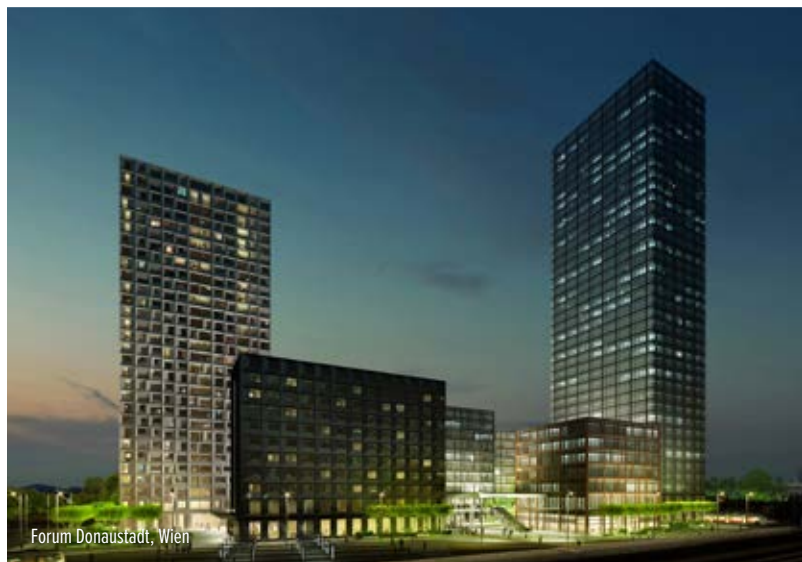
Forum Donaustadt, Wien