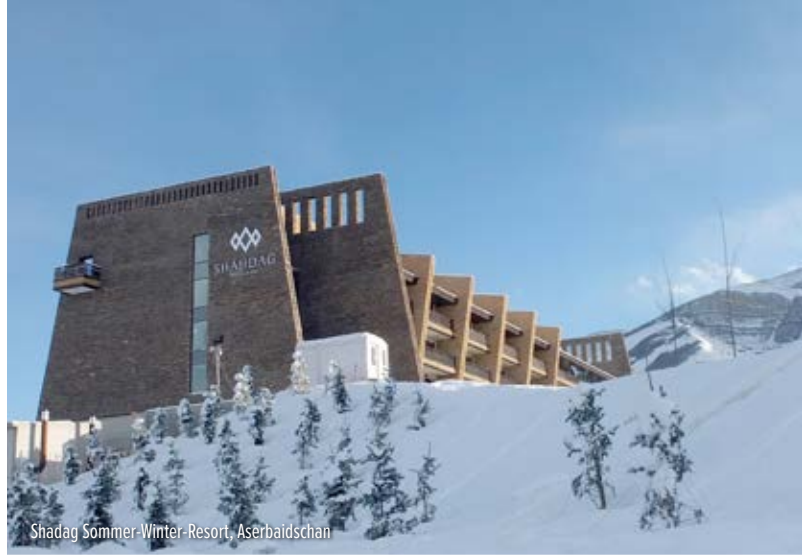
Shadag Sommer-Winter-Resort, Aserbaidschan