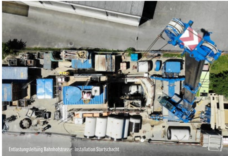
Entlastungsleitung Bahnhofstrasse: Installation Startschacht