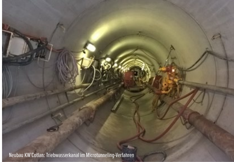
Neubau KW Cotlan: Triebwasserkanal im Microtunneling-Verfahren