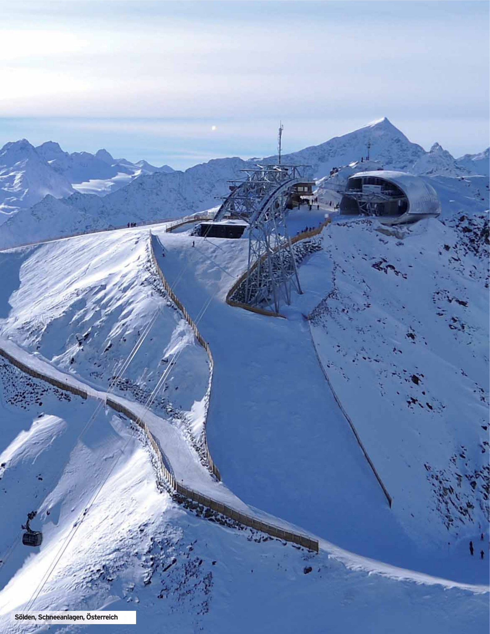
Sölden, Schneeanlagen, Österreich