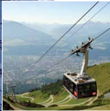
Innsbruck, Nordkettenbahn Neu, Österreich