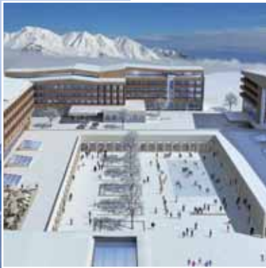
Shahdag, Tourismuskomplex, Aserbaidshan