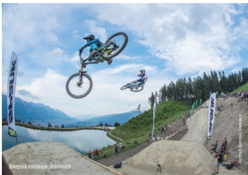
Bikepark Innsbruck, Österreich