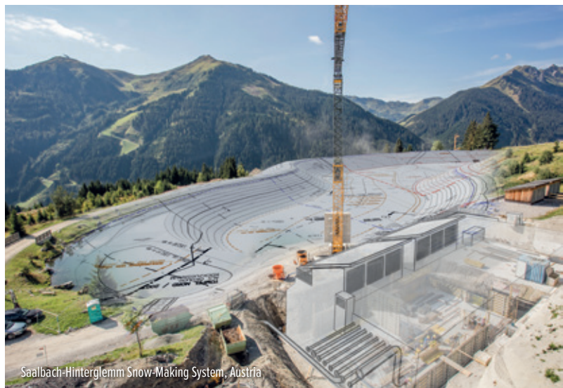
Saalbach-Hinterglemm Snow-Making System, Austria