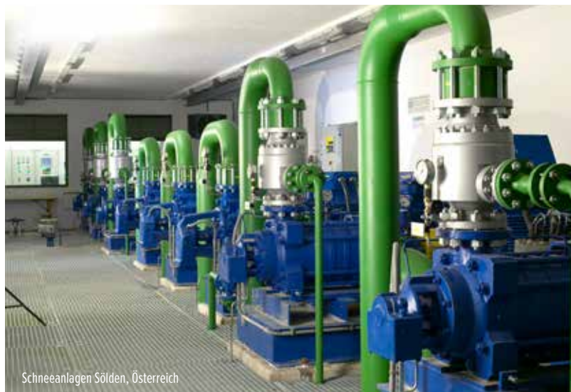
Schneeanlagen Sölden, Österreich