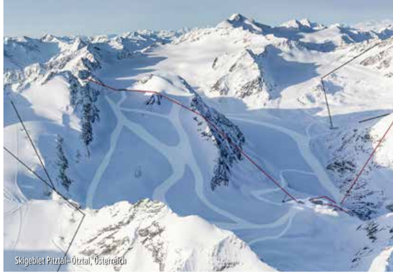
Skigebiet Pitztal–Ötztal, Österreich