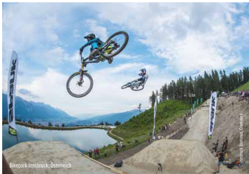
Bikepark Innsbruck, Österreich