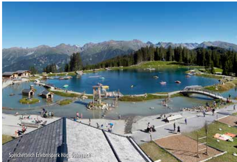
Speicherteich Erlebnispark Hög, Österreich