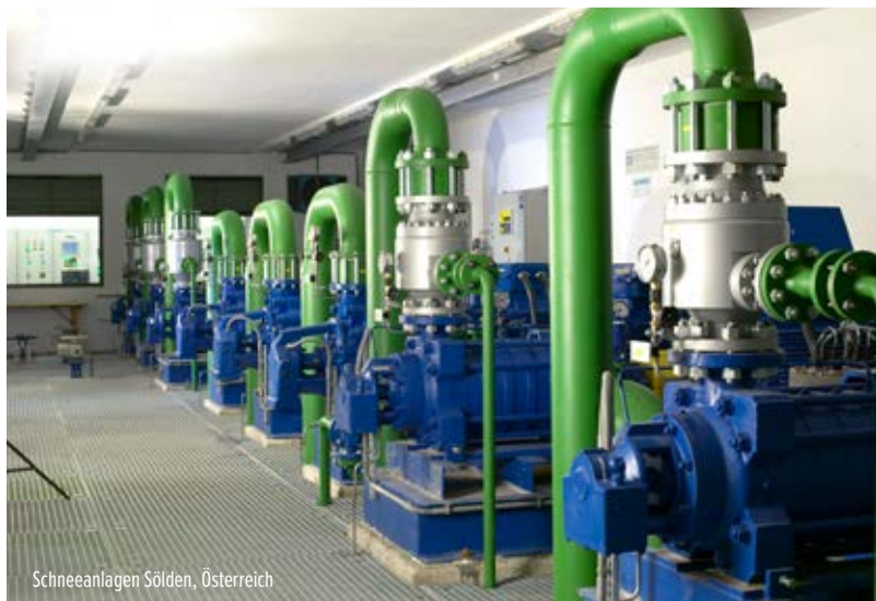
Schneeanlagen Sölden, Österreich