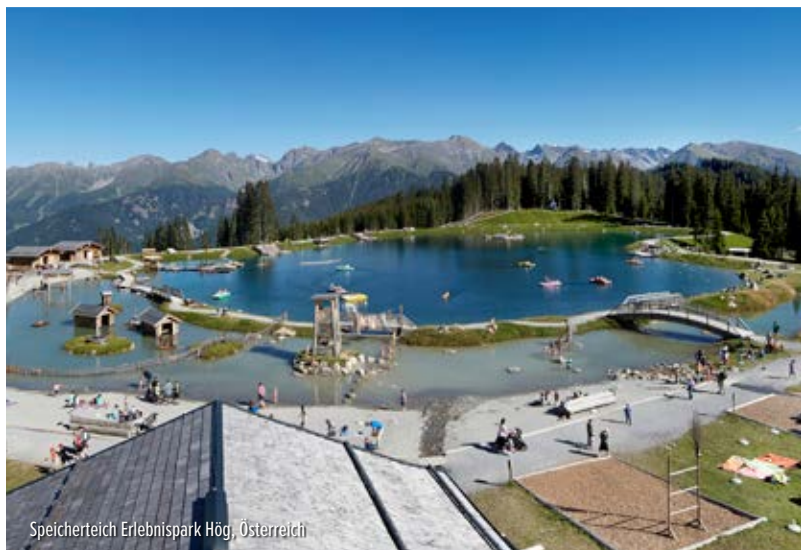
Speicherteich Erlebnispark Hög, Österreich