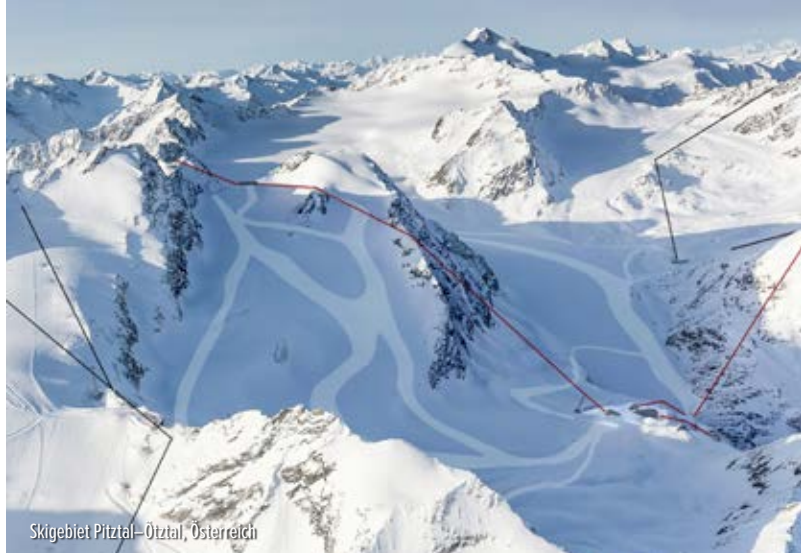
Skigebiet Pitztal–Ötztal, Österreich