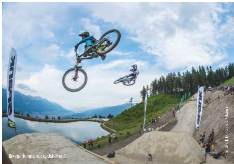
Bikepark Innsbruck, Österreich